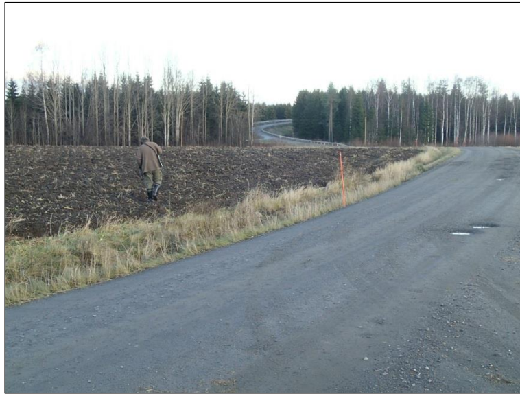
Rantalan itäpuoleista peltoa jossa viemäriinija kulkee tien vartta. Pohjoiseen.