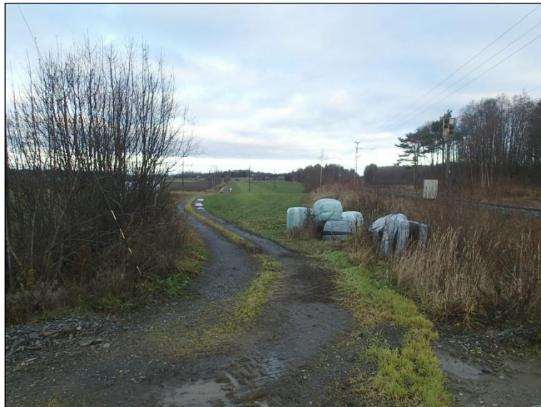
Radan vartta Mulossa, missä viemäriinija kulkee radan varressa. Pohjoiseen ja alla etelään.